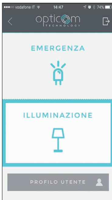
Typ zvoleného systému: nouzové nebo standardní osvětlení