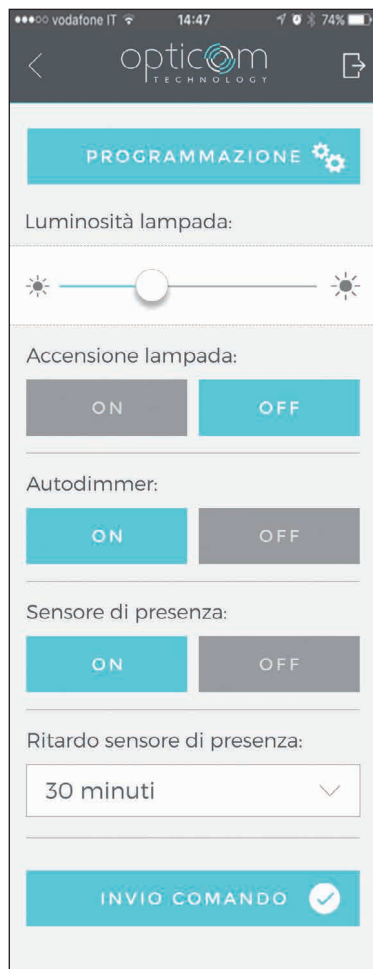
Příkaz, který umožňuje operátorovi přejít do sekce „programování“