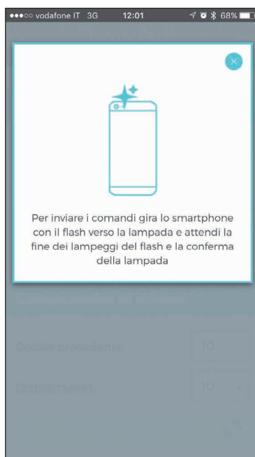
Upozornění na správné natočení smartphonu s bleskem směrem ke svítidlu