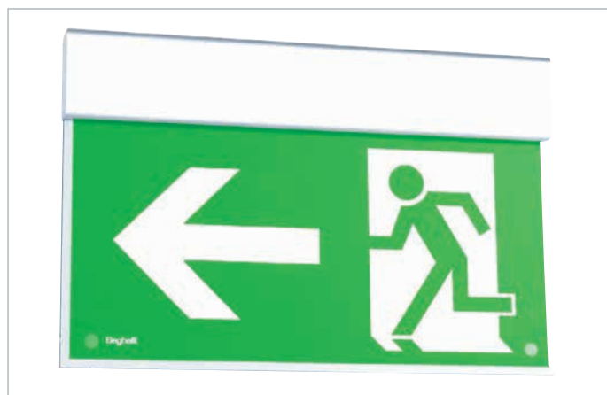
Model 60 m