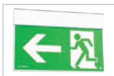
Model 20 m