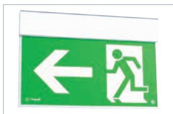
Model 30 m