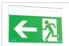
Model 20 m