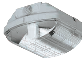
Provedení svítidla s reflektorem hlubokozářič

Svítlidla lze použít ve venkovních krytých zónách.