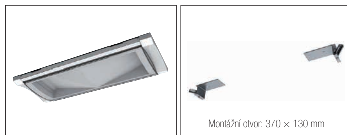
19041 DRŽÁKY PRO MONTÁŽ DO PODHLEDOVÉHO STROPU F65