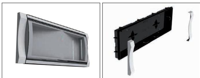
19040 VESTAVNÝ BOX S RÁMEČKEM F65