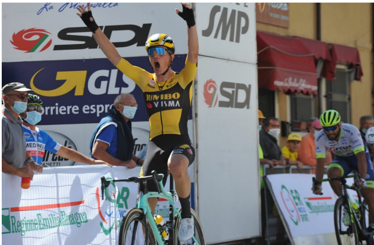
La vittoria di Olav Kooij a Gatteo nella "Coppi e Bartali" 2020

I nizia a delinearsi il calendario ciclistico 2021, nella speranza di avere un anno più sereno dal punto di vista sanitario.