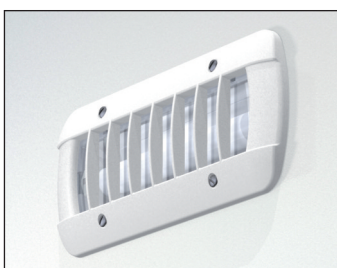
4622 PLACCA IP55 ANTIVANDALICI GRIGIO ANTRACITE RAL7016 da ordinare separatamente 4623 PLACCA IP55 ANTIVANDALICI GRIGIO CHIARO RAL7035 da ordinare separatamente