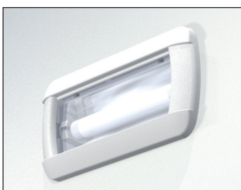
4621 PLACCA DI COPERTURA STANDARD COL. BIANCO da ordinare separatamente