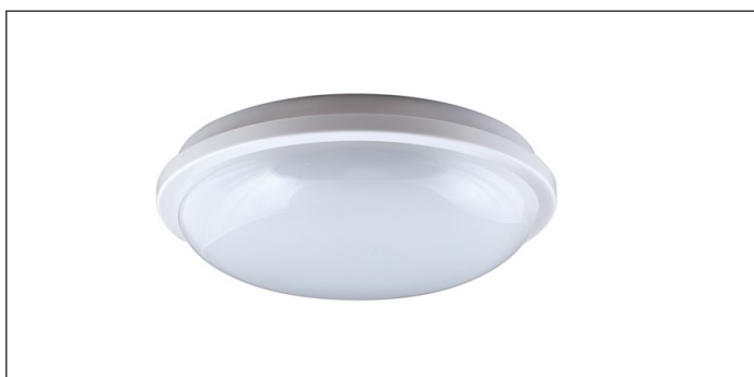
Wersja z białą ramką