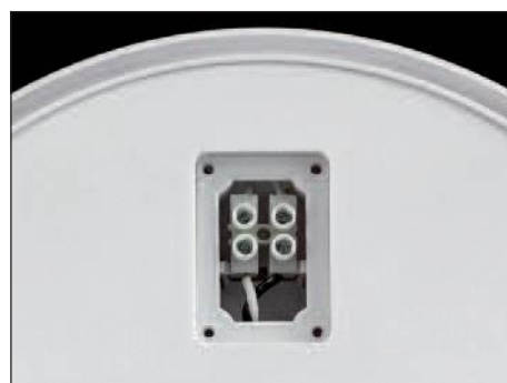
Szybki dostęp do listwy zaciskowej