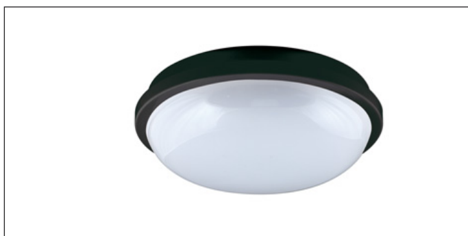
Wersja z czarną ramką