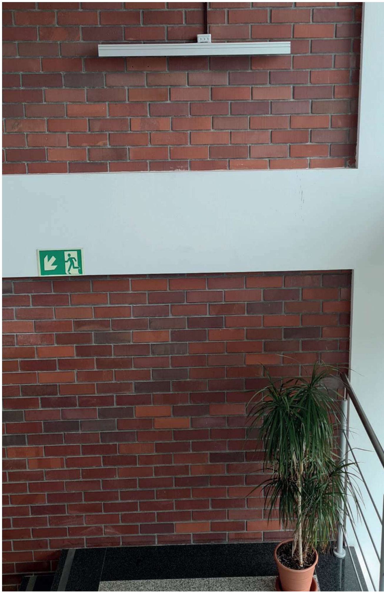
071 oprawy nastropowe i zwieszane