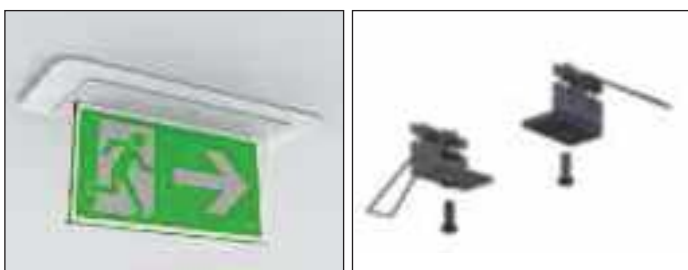
4266 UCHWYTY DOSTROPOWE należy zamawiać oddzielnie