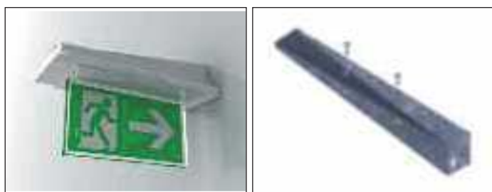
4265 UCHWYT ŚCIENNY DO OPRAWY DWUSTRONNEJ należy zamawiać oddzielnie