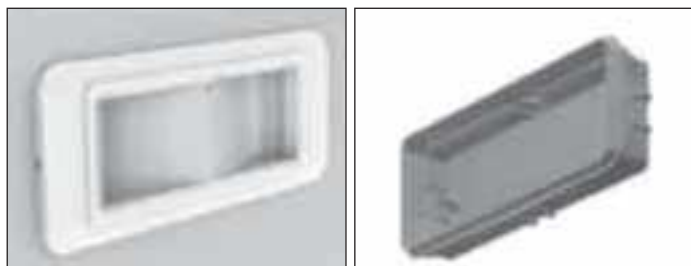
3733 PUSZKA DO WBUDOWANIA 6, 8, 11, 18, 24 W w komplecie