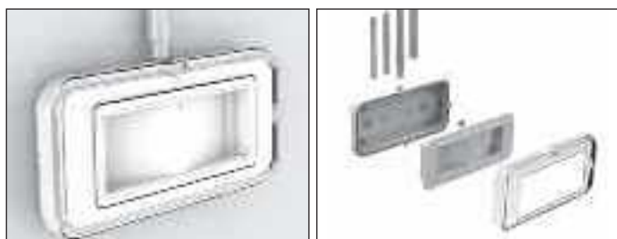
4112 ZESTAW USZCZELNIAJĄCY COMPLETA LED IP66 należy zamawiać oddzielnie