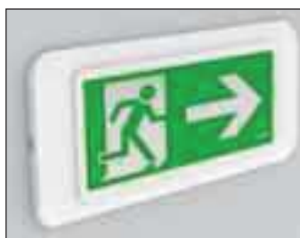
4278 KOMPLET PIKTOGRAMÓW – STRZAŁKA W LEWO, PRAWO, DÓŁ w komplecie