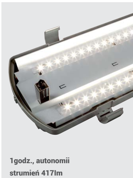
1godz., autonomii strumień 417lm