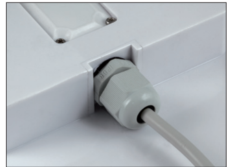
PG9 кабельный ввод