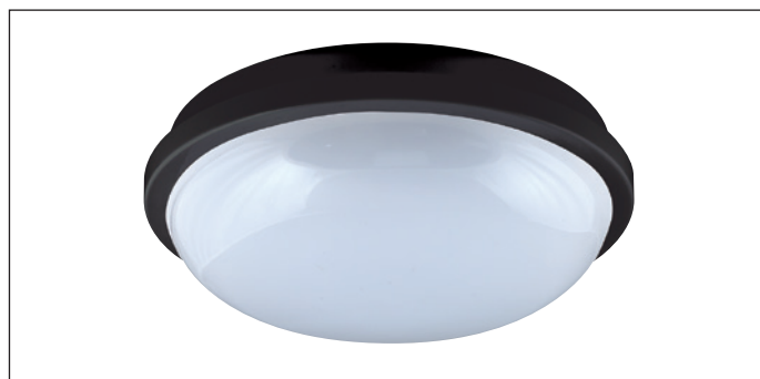
версия с черной рамкой