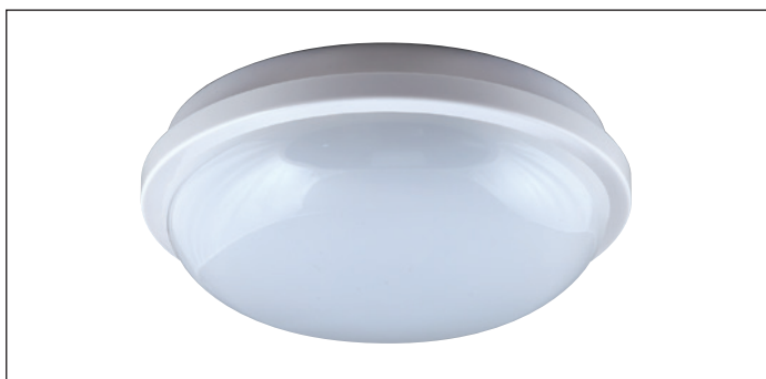
версия с белой рамкой